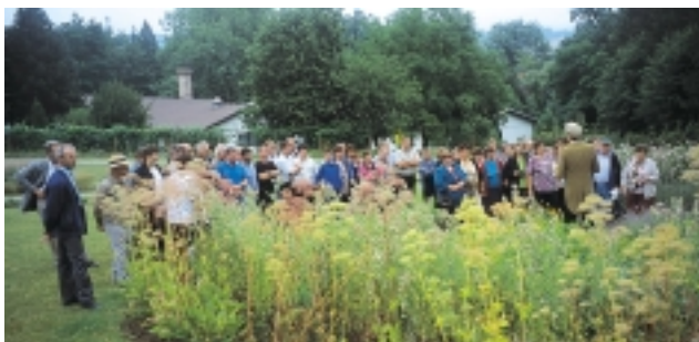
Člani združenja na strokovni ekskurziji